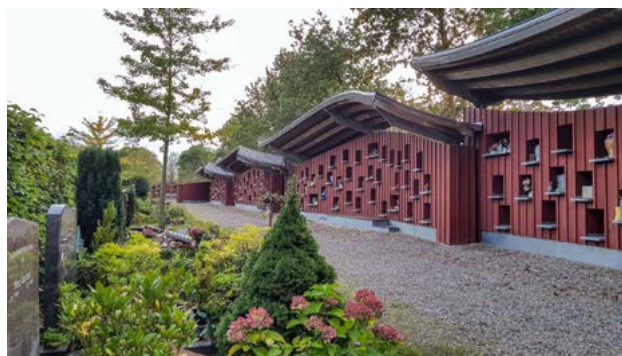
Gedenkmuur voor urnen