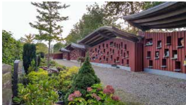
Gedenkmuur voor urnen

Begraafplaats Rhijnhof, Laan te Rhijnhof 4, Leiden