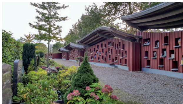
Gedenkmuur voor urnen