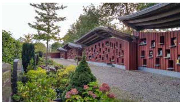
Gedenkmuur voor urnen

Begraafplaats Rhijnhof, Laan te Rhijnhof 4, Leiden