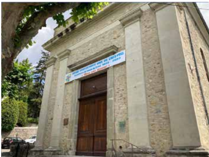
Protestantse kerk te Crest

Afgelopen zomervakantie waren we op vakantie in Frankrijk. We hebben daar twee kerkdiensten bijgewoond: eentje in Crest (in de Drome) en eentje in Anduze (de Cevenne). In Crest was het een gewone Franstalige dienst. Het aller-grootste deel ging aan mij voorbij. Alleen de opbouw van de liturgie kon ik volgen. We vonden het desondanks waardevol om onze verbondenheid met hen te beleven in hun dienst. In Anduze gingen we naar een tweetalige dienst: Frans en Nederlands. Een Nederlandse voorganger heeft daar een tweede huis en heeft met de Franse dominee daar een mooi plan gemaakt voor de vakantieperiode. Vroeger was er in Anduze 's morgens de gewone (Franse) dienst en 's avonds een Nederlandse vakantiedienst. 's Morgens zaten er dan ongeveer 30 tot 40 mensen in de kerk met misschien 10 Nederlanders en 's avonds zat de kerk bijna vol met ruim 400 mensen. Dit jaar kwam men dus met een nieuw initiatief: samen. We zongen liederen in het Frans en in het Nederlands. De gebeden waren tweetalig. Toen wij er waren was de preek in het Nederlands en konden de Franse broeders en zusters de preek volgen in het Frans via de beamer. De andere week was het precies andersom.