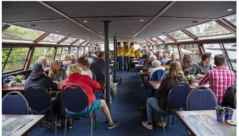
....aan boord van de boot op de dag zelf 5 juli 2024

Ter voorbereiding op de taken die wij kregen werd er vanuit de Bakkerij op 10 oktober 2023 een stadswandeling georganiseerd voor de leerlingen met twee ervaringsdeskundigen van de dak- en thuislozenzorg. Zij vertelden gedurende de middag op verschillende plekken in de stad hun eigen verhaal, en gaven veel informatie over de daklozen in Leiden die samenhang met deze locaties. Dit maakte bij ons veel indruk. Vanuit zo'n perspectief is het makkelijk om begrip te krijgen voor de situaties van deze mensen in de stad. De echte aftrap van de organisatie vond plaats in de Bakkerij op 9 april. Hierbij